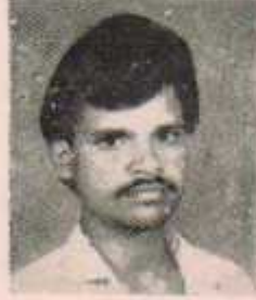
अध्यक्ष चमन भंडरवार