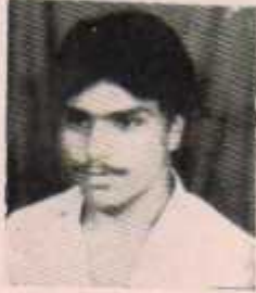
उपाध्यक्ष राजू जंगीलवार