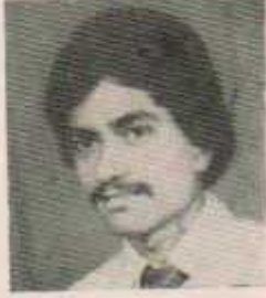
उपाध्यक्ष शेख मसूद