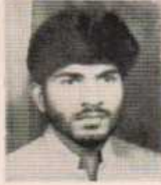
उपाध्यक्ष सायलू पिराजी कडलवार