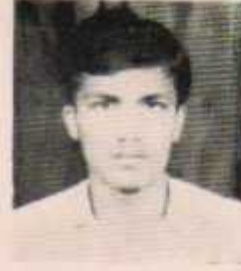
सचिव मुभाय आश्वमवार