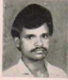
अध्यक्ष चमन भंडरवार