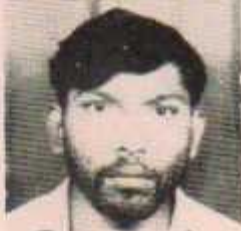
उपाध्यक्ष लक्ष्मण उल्लीवार