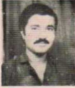
उपाध्यक्ष महादेव माका