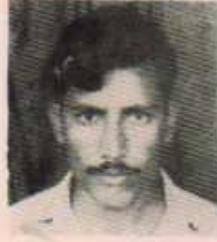
अध्यक्ष महणाजी निलमवार