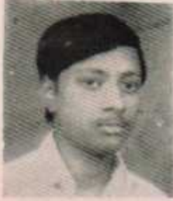
उपाध्यक्ष गिरीश चिद्रावार