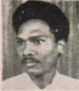
उपाध्यक्ष रामचंद्र भंडरवार