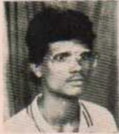
उपाध्यक्ष लक्ष्मीकांत पदमवार