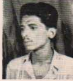
अध्यक्ष गंगाधर अपसलवार