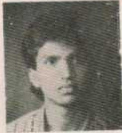
महसचिव विलास करत