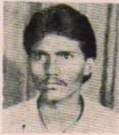
उपाध्यक्ष अशोक उल्लीवार